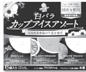
白バラカップアイスアソート(春夏期間限定)(6月発売予定)