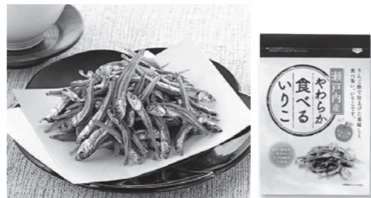
瀬戸内産やわらか食べるいりこ