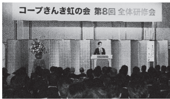
全体研修会の様子