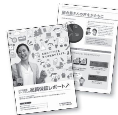
品質保証レポート