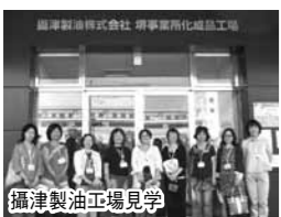
攝津製油工場見学

組合員9名、お取引先・関係者を含めて15名が参加しました。参加された組合員さんの感想 汚れ落としの実験でオレジンパワーがすごい威力を発揮したことに驚きました。まだ使ったことがないので、家のいろんな場所で試してみます。