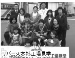
リバス本社工場見学

組合員15名、お取引先・関係者を含めて22名が参加しました。参加された組合員さんの感想 再生紙はあまり紙の質なども良くないイメージも少しありましたが、全く違ったので、これからぜひ使ってみようとも思いました。