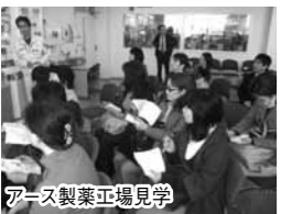
アース製薬工場見学

組合員10名、お取引先・関係者を含めて19名が参加しました。参加された組合員さんの感想 化学的な薬剤は人体に影響があるのでは?と思う、今まで敬遠していました。今日のお話を伺って、体内で分解し速やかに排泄されること事だったので、来年の夏はぜひ購入してみたい。