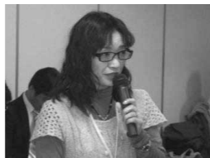
アース製薬工場見学の報告をいただきました

「くらしのパートナー組合員懇談会」では、お取引先を訪問しての商品学習会や工場見学会のとりくみをすすめています。 2011年度は商品学習会・工場見学会を合わせて5回のとりくみを行いました。