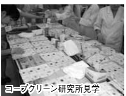
コープクリーン研究所見学

組合員6名、日本生協連関係者を含めて11名が参加しました。参加された組合員さんの感想 環境・人体にやさしく且つ洗浄力の高いギリギリの段階で商品ができていたことを知り、たいへんうれしく思いました。