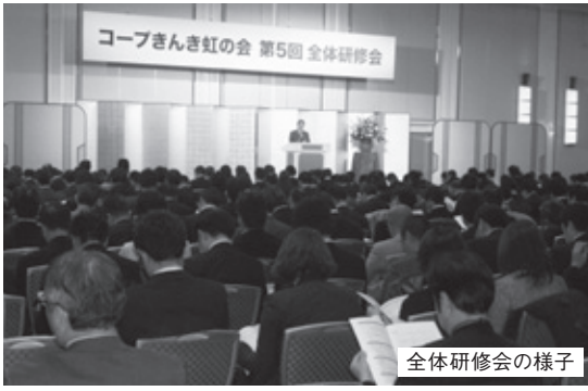
全体研修会の様子