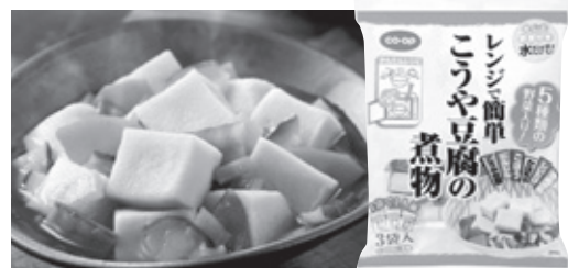
レンジで簡単 こうや豆腐の煮物

規格・価格への要望、「調理に便利な冷凍カットペーコンについて」の3つのテーマで、商品を開きながら楽しく活発な意見交換が行われました。