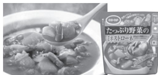
たっぷり野菜のミネストローネ