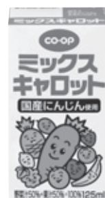
3月1回からリニューアルされたミックスキャロット