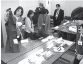
サンプル展示の様子