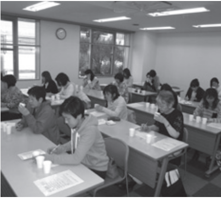
はと麦茶の飲み比べ

商品)などの商品開発・改善に関する意見集約や評価について、一つの会場に集まっていたらいいモニター活動を実施します。