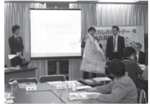
モニター商品の説明

3月20日(木)日本生協連生協会館新大阪において、2013年度第5回くらしのパートナー組合員懇談会を開催しました。会員生協(コープ北陸含む)組合員18名、お取引先7社13名等、合計47名が参加しました。