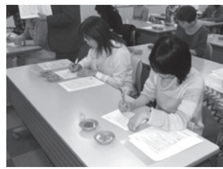
いくら醤油漬の比較試食