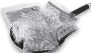
蒸し野菜と豚肉の生姜ソース和え(サラダ付)

肉・魚・麺+カット野菜+タレのキットや、お好み焼・焼きそばなどの下ごしらえ済み、フライパン調理・大皿メニューを提案して、子育て・ファミリー層の有職主婦の夕食の手作りを支援しています。「調理の時短」と調理器具や食器の使用を減らすことでの「後片づけの時短」を実現します。栄養バランスを考えた管理栄養士監修メニューも配置しています。