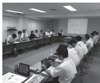
幹部職員学習会の様子

コープきんきでは、8月を「コンプライアンス月間」と位置づけています。外部講師を招いての幹部職員学習会や、全職員を対象にした学習会を実施しました。全職員対象の学習会ではコープきんきコンプライアンス行動規範と事例について学習しました。取り組みを継続することで職場の意識を高め、コンプライアンス経営の強化につなげていきます。