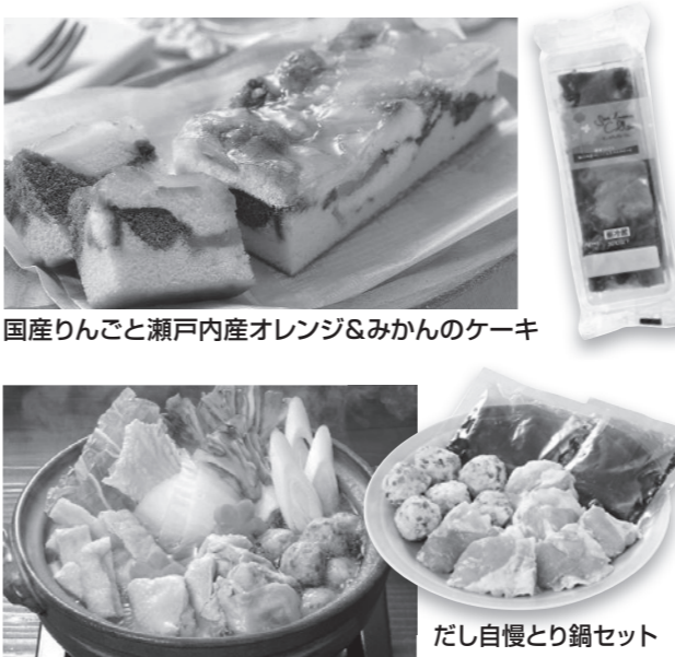
国産りんごと瀬戸内産オレンジ&みかんのケーキ