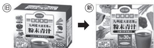
【九州産大麦若葉の粉末青汁】