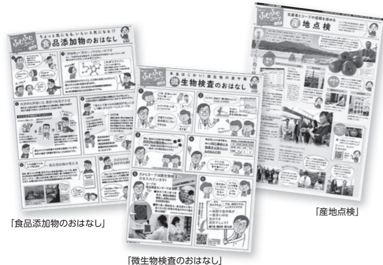
【食品添加物のおはなし】