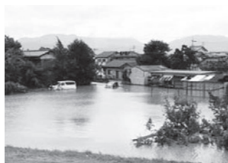
濁流で冠水した長野市内