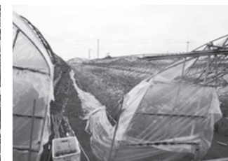
ビニールハウスの倒壊