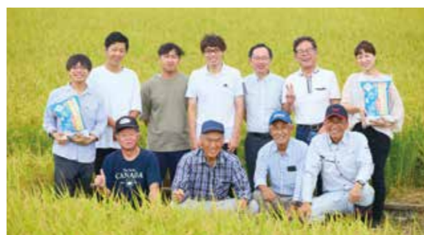
農事法人組合 愛農の郷の皆さんと訪問した生協職員

コープきんきでは会員生協とも連携し、安全性が確保された環境にやさしい農水畜産物を安定的に組合員にお届けするとともに、持続可能な農水畜産業をめざして産直事業に取り組みしています。