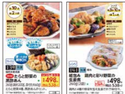
ミールキットに多くのご意見をいただきました