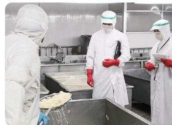
工場での原材料の確認